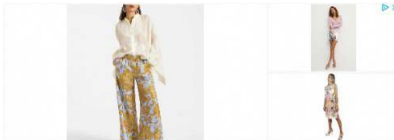
Abbigliamento Donna Stileo.it

Beatrice Luzzi torna al Grande Fratello come opinionista, a fianco di Cesara Buonamici. Una scena azzeccata e molto apprezzata dal pubblico, che ha atteso con ansia il suo arrivo in studio. Inizialmente, infatti, è stato possibile vedere in studio solo Cesara, che a distanza ha parlato